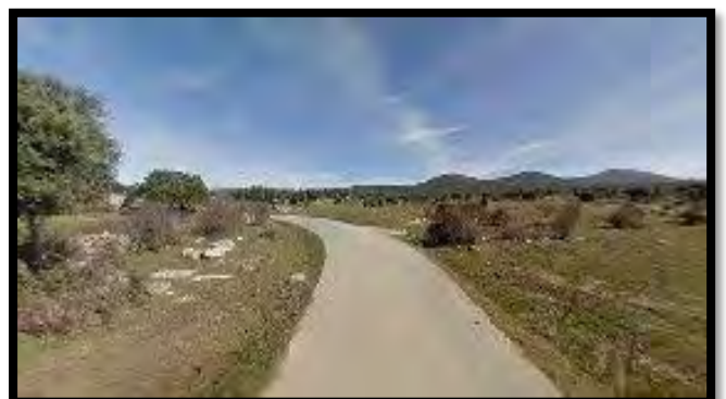
Camino por el que discurre la Peregrinación