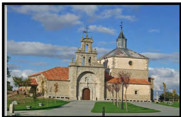
Ermita de San Antonio