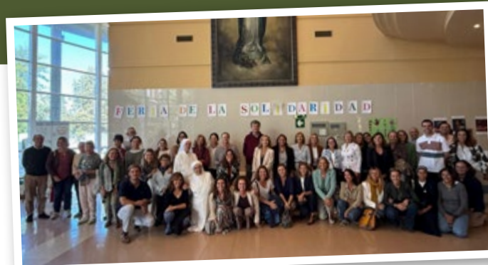
Libres para acompañar

Cada día puedo pensar si saludo con cariño, si escucho sus consejos, si les pregunto cómo están y me intereso por ellos... tantas formas tan sencillas de servir.